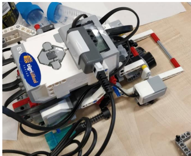
Joonis 1. Robot pealtvaates

Kasutame 3 mootorit, kahte vedamiseks ja ühte haaratsi liigutamiseks. Meie roboti teeb eriliseks see, et tal on mingit rohelised vedruga asjad all.